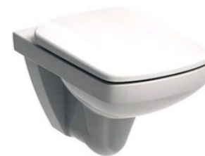
WC ZÁVĚSNÉ 200 x 500x 500