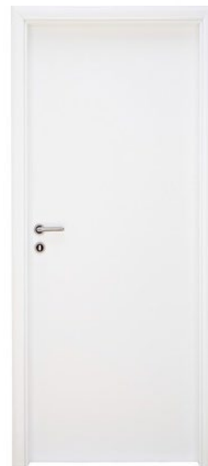
Plné s obložkami MDF BÍLÉ

Dodávány jsou protipožární dveře do ocelových zárubní v šedém provedení.