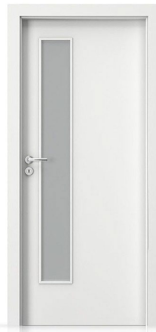
Prosklené s obložkami